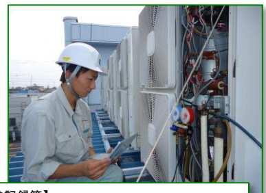
【冷媒漏えい点検記録簿】

上記で行われた点検を含め、機器の修理、フロンガスの充填・回収の履歴を記録・保存します。また、機器の整備の際に、整備業者の求めに応じて履歴を開示しなければなりません。